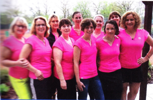
Wir sind lustig und schlagfertig!

Nachdem wir uns seinerzeit schweren Herzens auf zwei Mannschaften (Damen 30/ Damen 40) aufteilen mussten, weil wir einfach zu viele waren, gibt es uns nun seit fünf Jahren als Mannschaft. Wir sind eine ‚Gute-Laune-Mannschaft‘ mit Teamgeist und hohem Spaßfaktor beim Tennisspielen. Jede darf und soll spielen. Natürlich freuen wir uns ausgelassen über gewonnene Matches, aber über verlorene Punkte wird nicht lange Trübsal geblasen - jede gibt ihr Bestes! Im Winter treffen wir uns zu gemeinsamen Sofarunden.