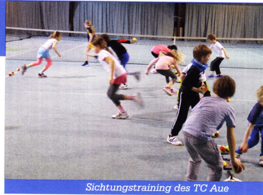
Sichtungstraining des TC Aue

Klar, der Tennissport spielt sich natürlich nicht nur im Rahmen von Training und Wettspielen ab. Ganz im Gegenteil: Wann immer Du möchtest, kannst Du als Vereinsmitglied auch ohne Trainer auf