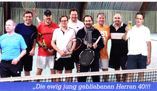
„Die ewig jung gebliebenen Herren 40!!!“

Herren 40 mit. In der ersten Saison wurde der Aufstieg knapp verpasst, aber der Abstieg konnte glücklicherweise auch vermieden werden. Kein Wunder, wenn man in der niedrigsten Klasse spielt.