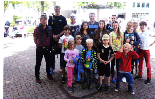
Ausflug zu den German Open am Rothenbaum in Hamburg

Hast Du Lust den Tennissport einfach mal auszuprobieren? Dann melde Dich bei uns: jugendwart@tcaue.de oder Tel. 04103 14884.